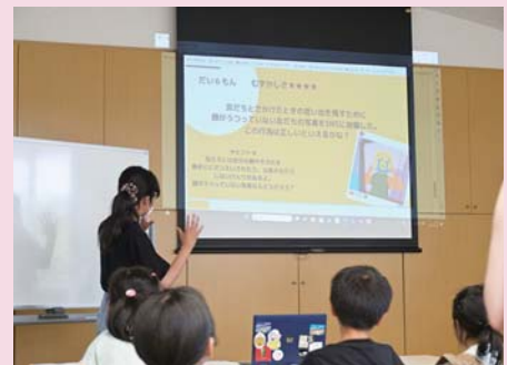
福島大学 BBS サークルの学習支援活動の様子