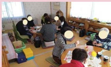
子ども園での社会貢献活動の準備風景 (保護司会、更生保護女性会、BBS 会員の皆さん)