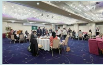
70周年記念式典の様子

我々自身、このように大きなイベントを開催することが初めてだったため、至らない点もあったかと思いますが、式典の運営に携わっていただいた青葉区 BBS 会のOBの方々のご協力のおかげで、多くの方々にご好評をいただくことができました。