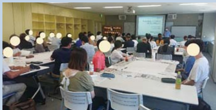
東北地方 BBS 会員研修の様子 (R5.8.11 アピオあおもりにて)

新人会員研修や他の団体の活動にも積極的に参加し、広い意味での BBS 活動に努め、会員獲得に向けて動いています。