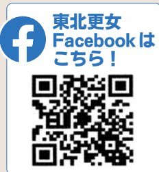
東北更女 Facebookはこちら!

東北各県の更生保護女性連盟からなり、研修会の実施や「子育て支援地域活動」への助成を通じて、犯罪や非行のない明るい社会の実現を目指す更女活動を支援します。