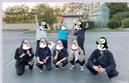
球技大会で BBS 会員と記念の一枚

そんな中、令和5年9月には4年ぶりの県連事業「第62回岩手県児童福祉施設球技大会」が再開されました。しかし、スタッフとなるBBSの参加が少なかったことから、今後、県連・地区会の事業について見直さなければならない時期にあるものと思われます。