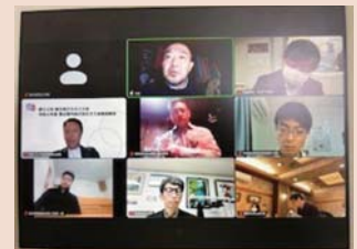
BBS 会員研修会 (グループワーク)