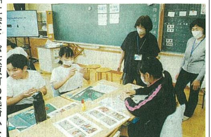
女性の会のメンバー(奥)に教わりながら鈴を作る児童=下呂市で