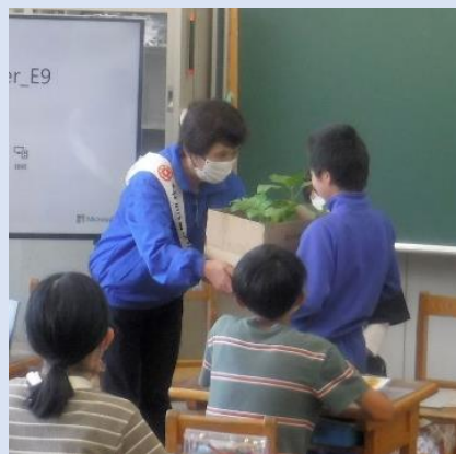
ひまわりの苗を児童にわたす

小坂小学校 私は、刑務所から出てきた人がいたら「怖いな」などと思ってしまいます。でもそのように思う人がたくさんいたら刑務所から出てきた人はすぐ傷つくと思うし、人の目を気にしてしまい再犯をしてしまうかもしれないということをこの授業を通して考えるようになりました。だから、これからは相手の気持ちを考えて行動したいと思います。