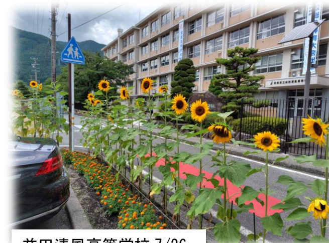
益田清風高等学校 7/26