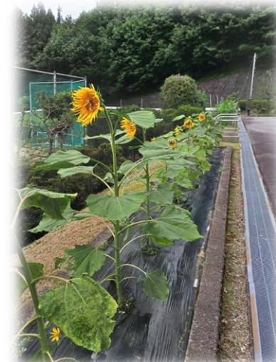
下呂特別支援学校 7/13